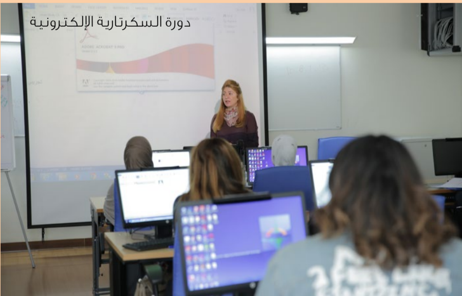
دورة السكرتارية الإلكترونية