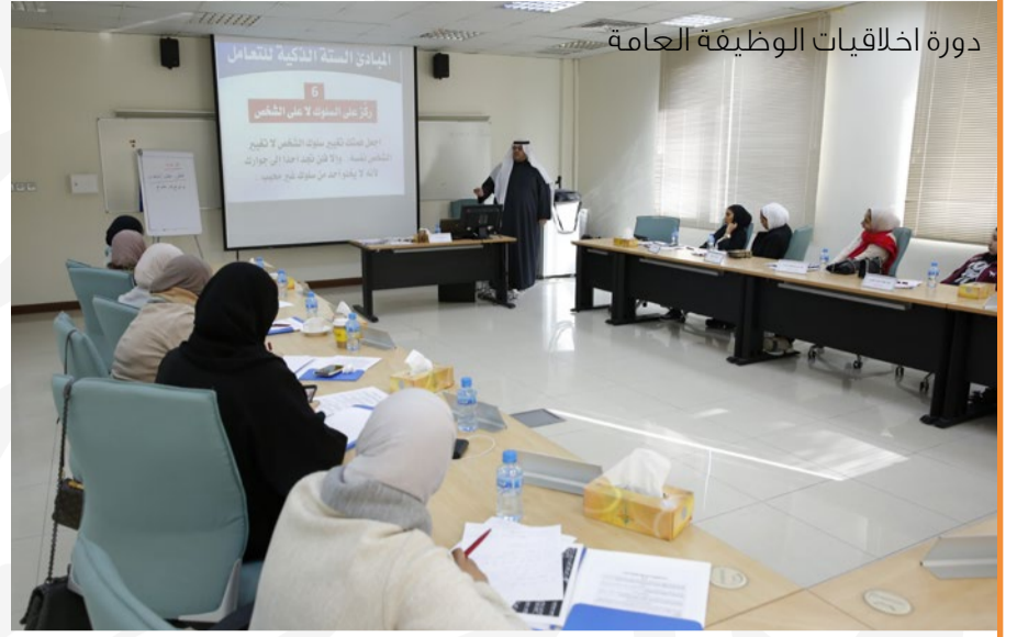
دورة اخلاقيات الوظيفة العامة