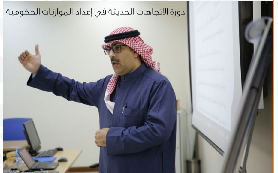
دورة الاتجاهات الحديثة في إعداد الموازنات الحكومية