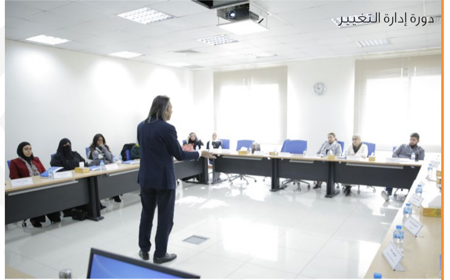
دورة إدارة التغيير