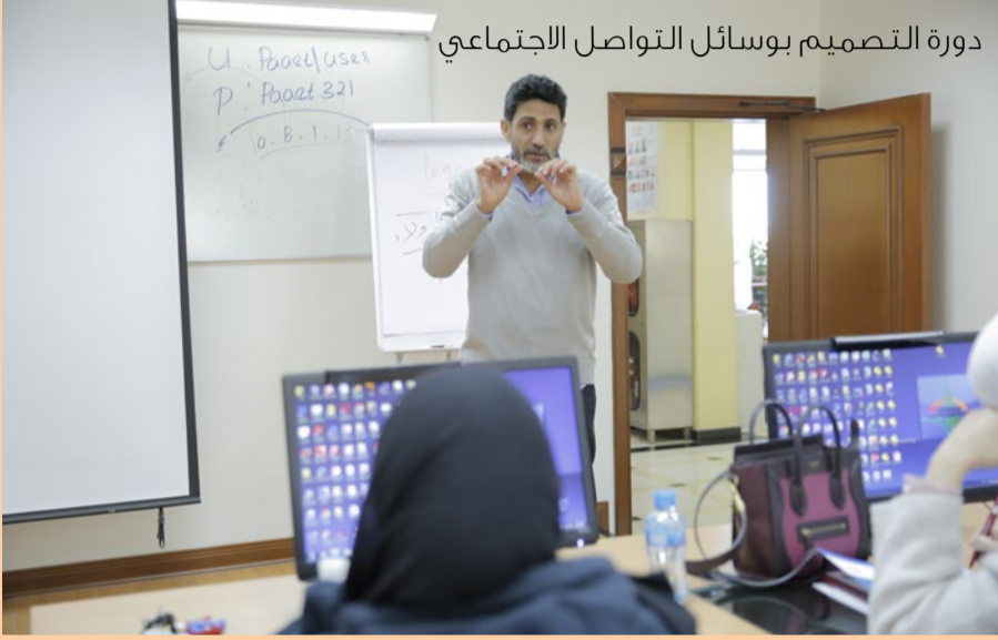
دورة التصميم بوسائل التواصل الاجتماعي