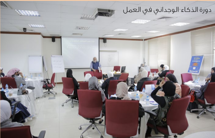
دورة الذكاء الوجداني في العمل